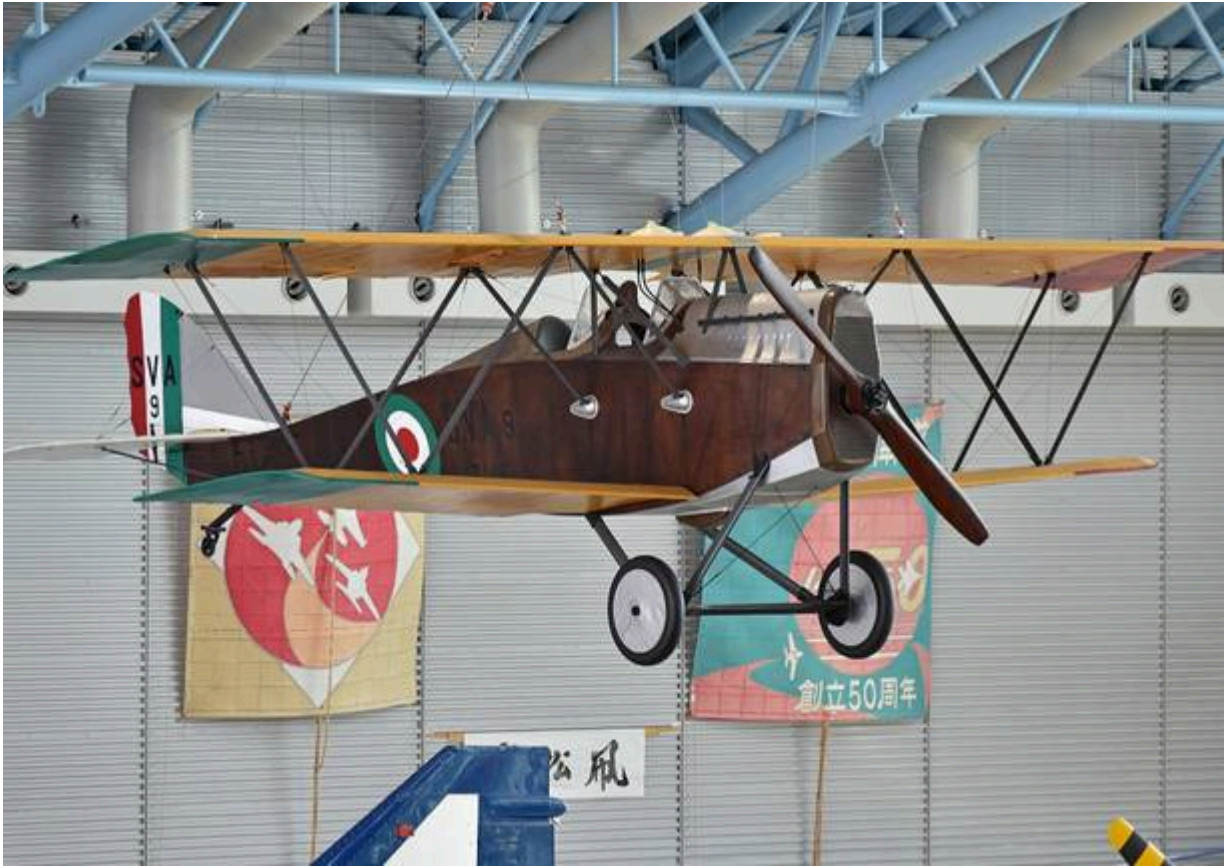
Replica di Ansaldo SVA esposta al museo delle Forze aeree di Difesa del Giappone, foto wikipedia

Con quella impresa Ferrarin divenne un vero eroe dell'aria, un pioniere , un esempio conosciuto a livello mondiale. Di certo la sua memoria si è tramandata fino ai nostri giorni nel mondo degli appassionati , grazie a innumerevoli articoli e pubblicazioni, agli omaggi nei musei, persino a una apparizione nel film d'animazione Porco Rosso , capolavoro del giapponese Miyazaki (anche se nel film Ferrarin è presentato come figura che ha sacrificato la libertà del volo al lavoro “sotto padrone” per l'Italia fascista).