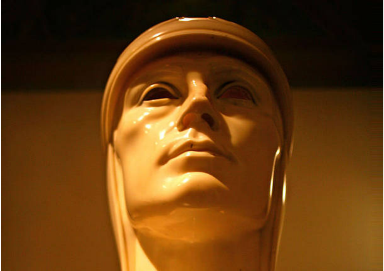
Ritratto di Ferrarin, dello scultore Adolfo Wildt

Proprio il Comune di Induno ha mantenuto una forte memoria della figura di Ferrarin, dedicando un vasto programma di eventi per il centenario (spostati dal 2020 al 2021 per ragioni di pandemia). Lo stesso Comune ha contribuito alla produzione di un nuovo spettacolo teatrale , di Karakorum Teatro: “Io volo” è andato in scena in anteprima nazionale a Varese il 4 dicembre 2021 .