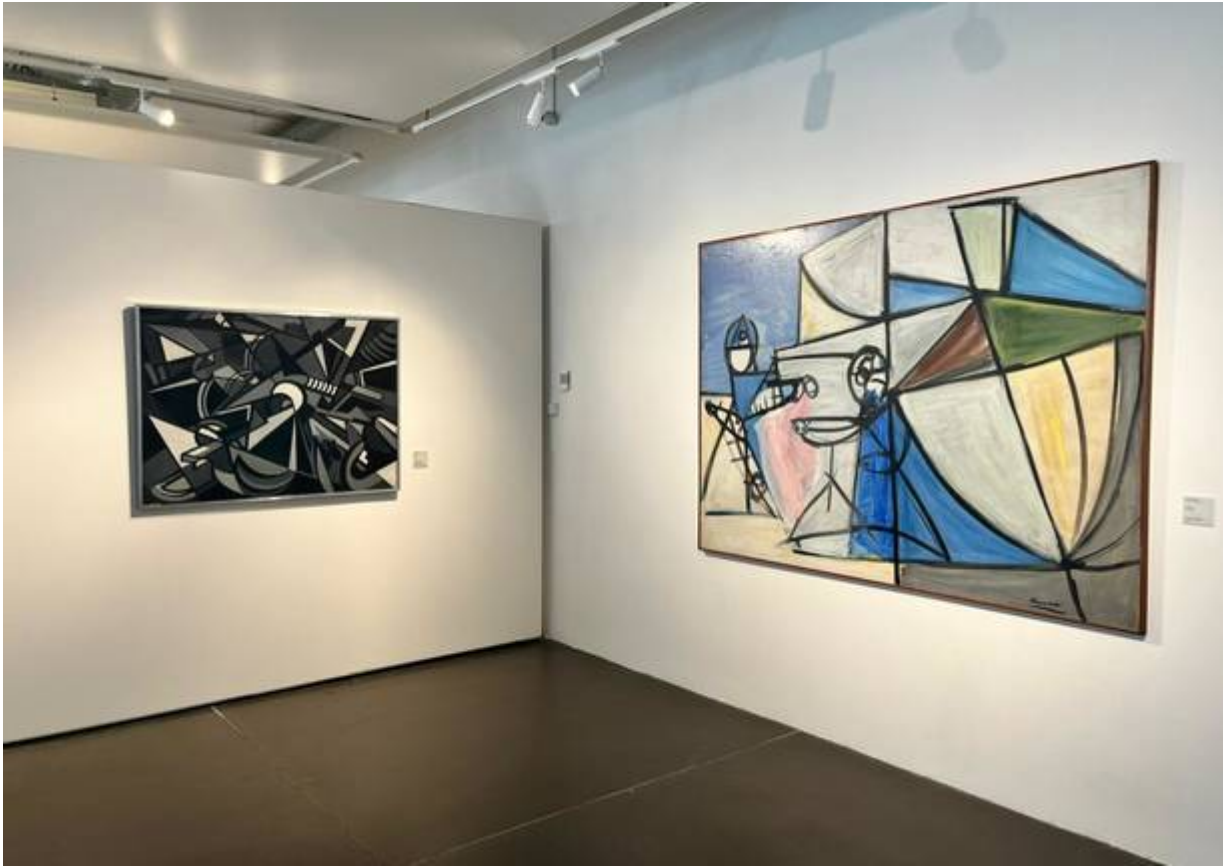
“L’urto” di Emilio Vedova e “La Pace” di Ennio Morlotti

Il percorso espositivo si apre con una serie di dipinti che affrontano in modo diretto o indiretto il tema della seconda guerra mondiale e della ricostruzione postbellica a cavallo tra gli anni quaranta e cinquanta del secolo scorso. Ne è esempio emblematico L’Urto di Emilio Vedova in cui le vorticosi forme geometriche sono un riferimento al dramma e alla violenza della guerra. A queste opere risponde il grande dipinto La Pace di Ennio Morlotti , in cui il linguaggio cubista ricorda in modo diretto il Picasso di Guernica , dove un’arte impegnata, moralmente e politicamente, racconta la storia nelle sue drammatiche vicende di trasformazione.