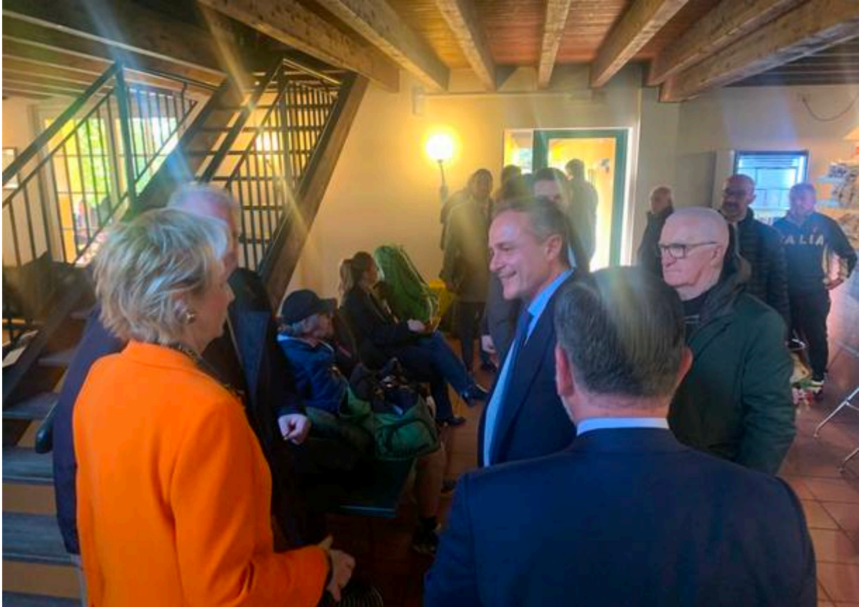
Un momento del pranzo con il Rotary al circolo del tennis di Gallarate

Cita due nodi locali. ?Prima di tutto la prospettiva dell'ospedale unico Gallarate-Busto, avendo presente però che qualche problema c'è: « La Regione deve garantire un passaggio molto morbido verso il nuovo ospedale, che tutti i servizi vengano garantiti e sia garantita la presenza del personale».