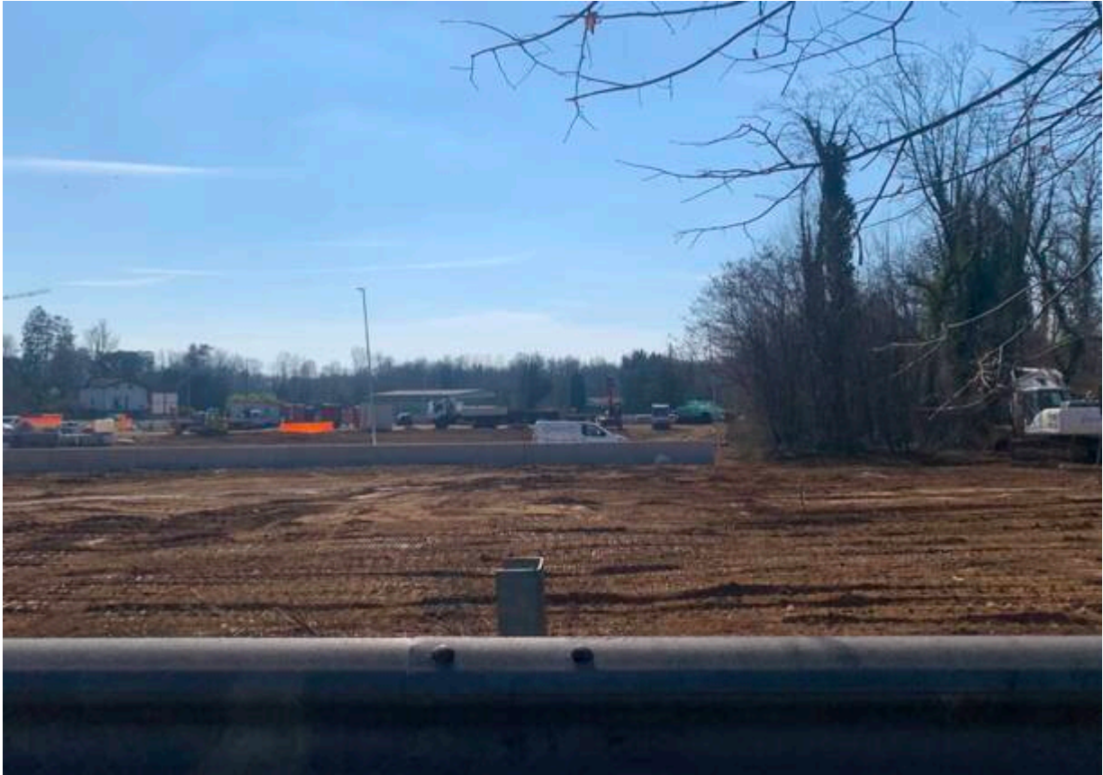
Cantiere in allestimento a Casorate Sempione, nuova ferrovia Gallarate-Malpensa

Terzo tema: il suolo è custode di carbonio , conserva quattro volte la quantità di carbonio che c’è in atmosfera e che oggi preoccupa per i cambiamenti climatici. Il grosso del carbonio rimane sottoterra, «a meno che non andiamo lì con una ruspa. Ma nell’impatto della costruzione di un’autostrada questo aspetto non viene calcolato».