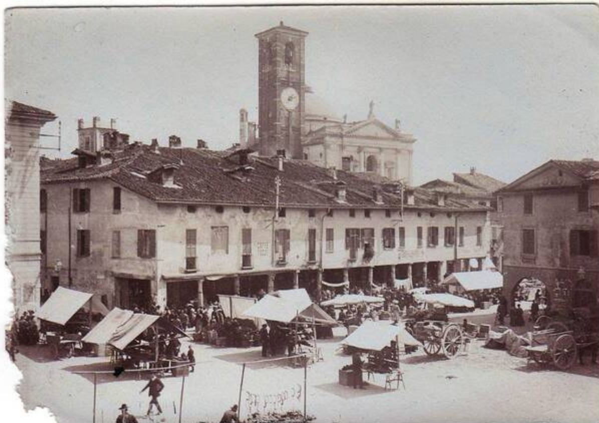
I portici di piazza Garibaldi dove stava il Caffè Pozzi; fotografia risalente alla fine dell'Ottocento