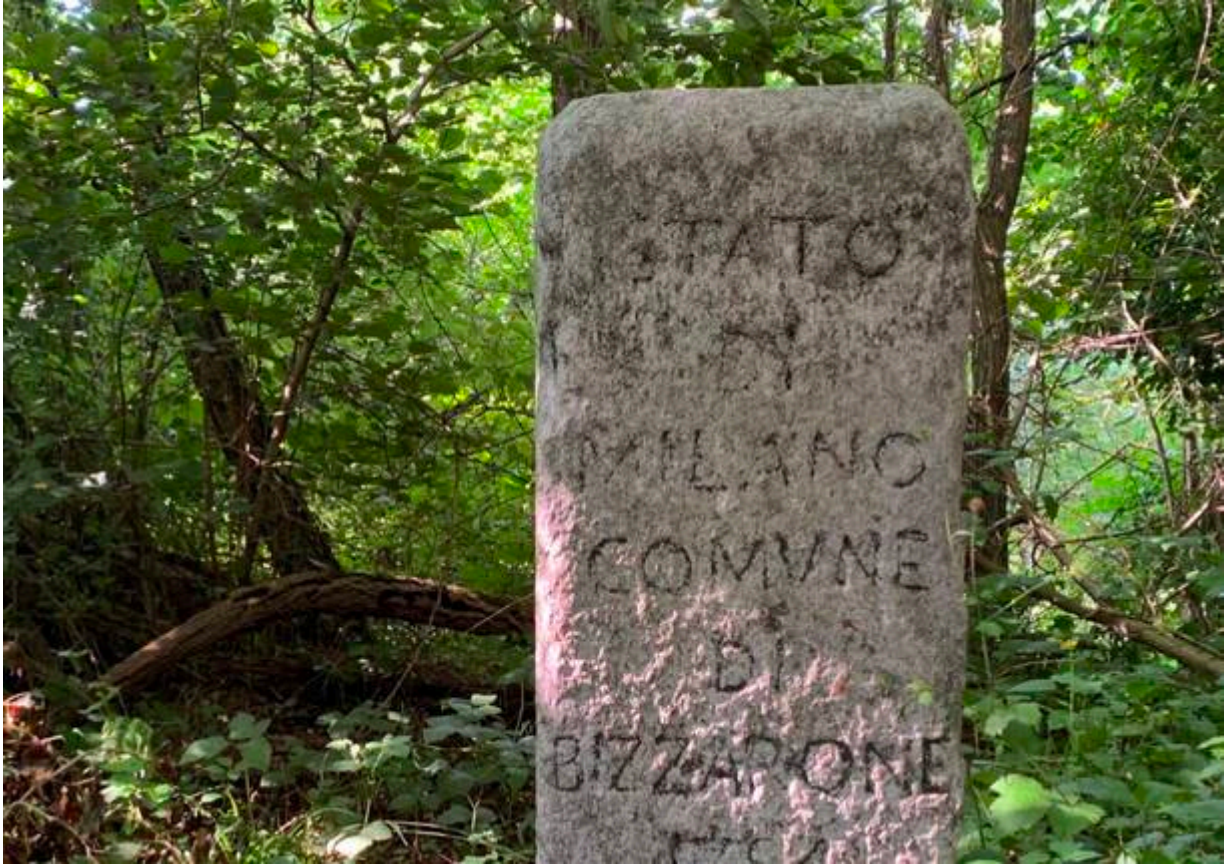
Cippo di confine cinquecentesco tra Stato di Milano e Confederazione elvetica

Punto di approdo è Mendrisio , dove il percorso termina nei pressi della stazione ferroviaria: da qui si può ripartire in treno TiLo verso Varese, Como o Milano ( qui tutte le linee ).