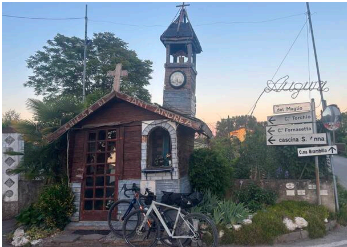
La chiesetta di Sant'Andrea alla Cascina Maglio di Albignano

All'altezza del paese di Truccazzano si lascia la ciclabile e s'imbocca la provinciale che scavalca l'Adda verso Rivolta: questo tratto di due chilometri è su strada principale e va affrontato con attenzione e senza indugiare , specie sul ponte.