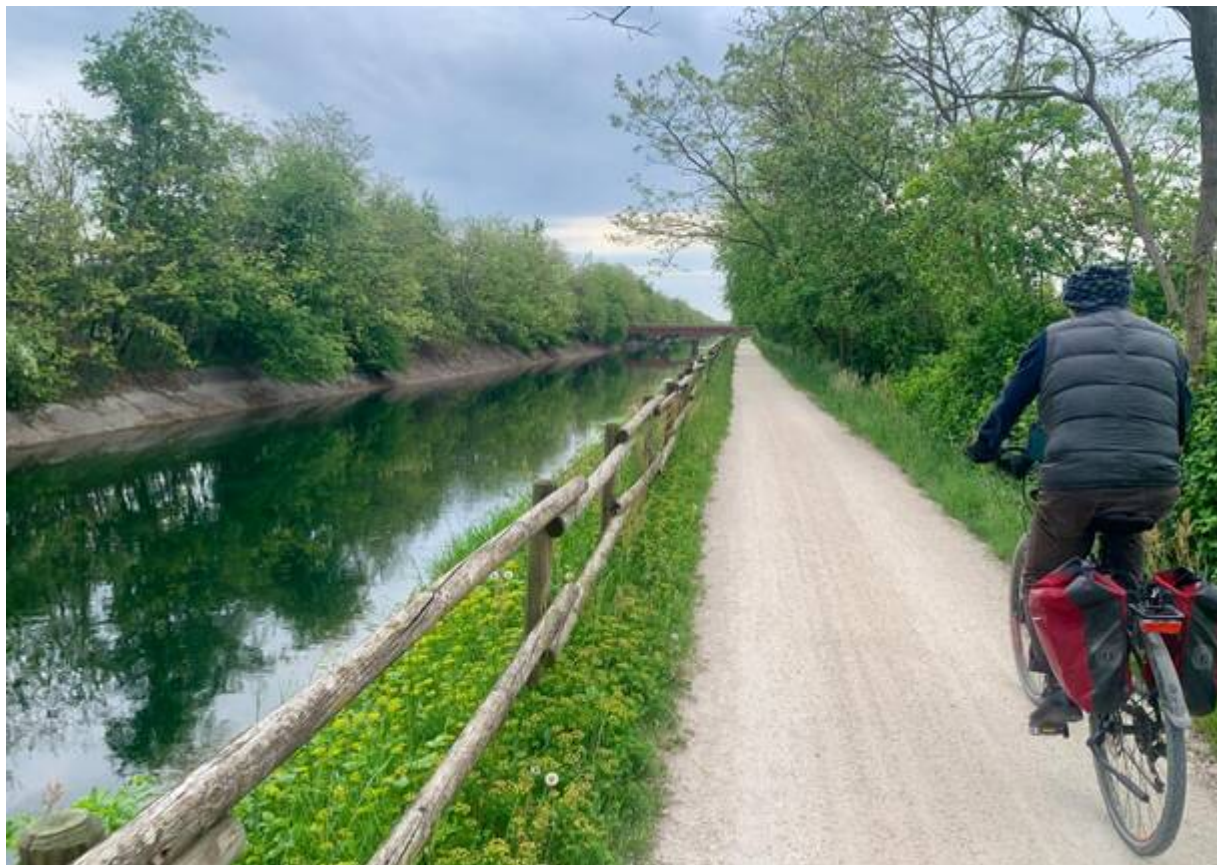
Sulla ciclabile del Villoresi nel tratto vicino a Tornavento

La ciclabile del Villoresi si può prendere sotto Tornavento oppure più avanti all'altezza delle dighe della centrale di Vizzola. L'itinerario protetto segue le acque del Canale Villoresi , un capolavoro ingegneristico di fine Ottocento nato dall'estro di Eugenio Villoresi, per irrigare l'alta pianura lombarda.