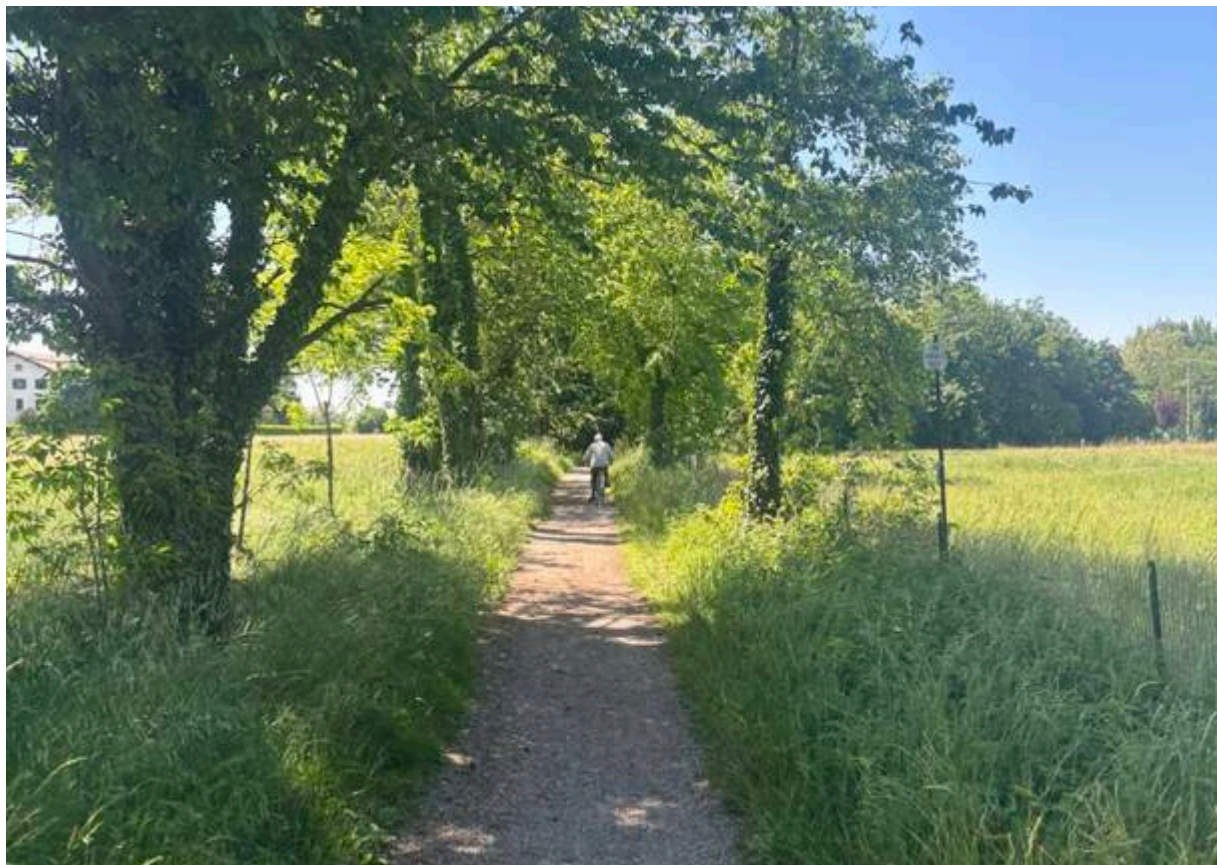
Nella zona del Parco Fontanile

Passata la periferia di Brugherio , si attraversa un'area di residua campagna – sopravvissuta tra fabbriche e paesoni – sfruttando il “ parco Increa ” (un ex cava divenuta laghetto, che regala anche frescura) e poi il Parco Fontanile di Cernusco sul Naviglio .