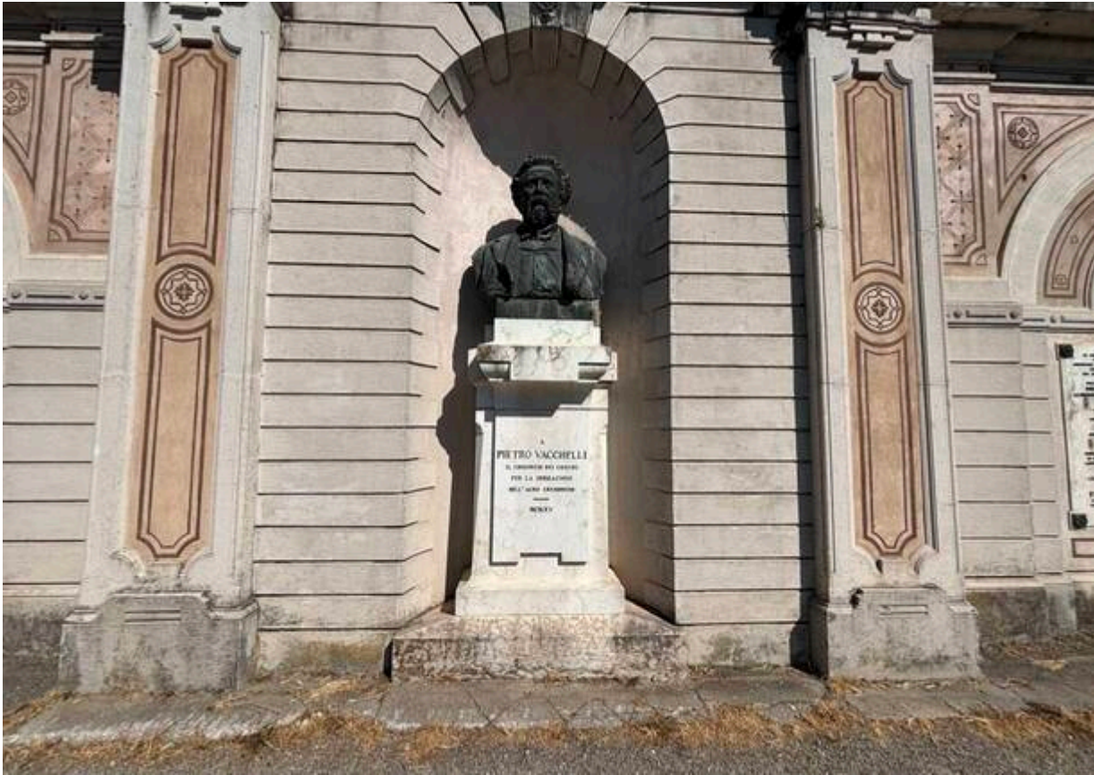
La diga di presa del Canale Vacchelli

A Crema conviene entrare in città e riprendere poco oltre il canale. In altri punti i campanili vi segnaleranno uno dei tanti placidi paesi di pianura, dove trovare un pranzo volante, un caffè, una bibita fresca.