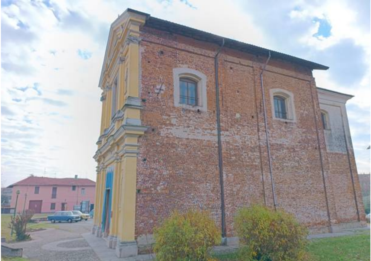
Il santuario della Colorina

In località stazione di Garbagnate Parco delle Groane si usa il sottopasso – attrezzato con rampe per le bici – mentre a Palazzolo Milanese un curioso ponte elicoidale consente di scavalcare il fiume Seveso: i fiume che scendono dal Saronnese e dalla Brianza sono segnati dall'inquinamento, ma non mischiano mai le acque con quelle del Villoresi, che si mantengono trasparenti come alla presa di Panperduto sul Ticino.